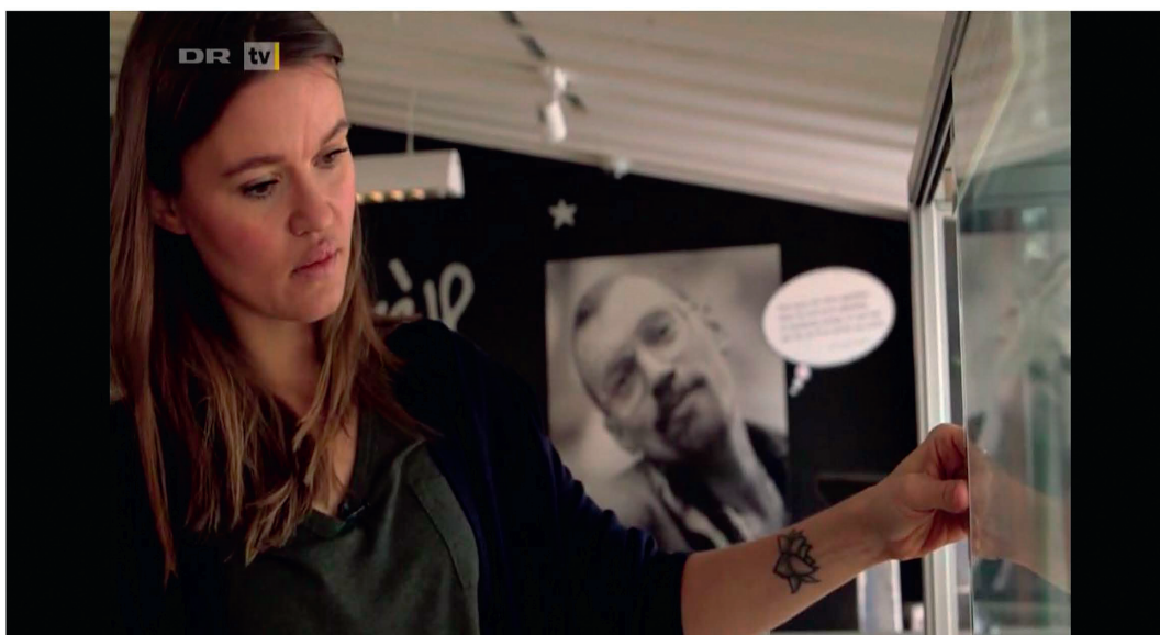
Screendump fra dokumentaren Lotus og den fulde sandhed , DR TV 2016.